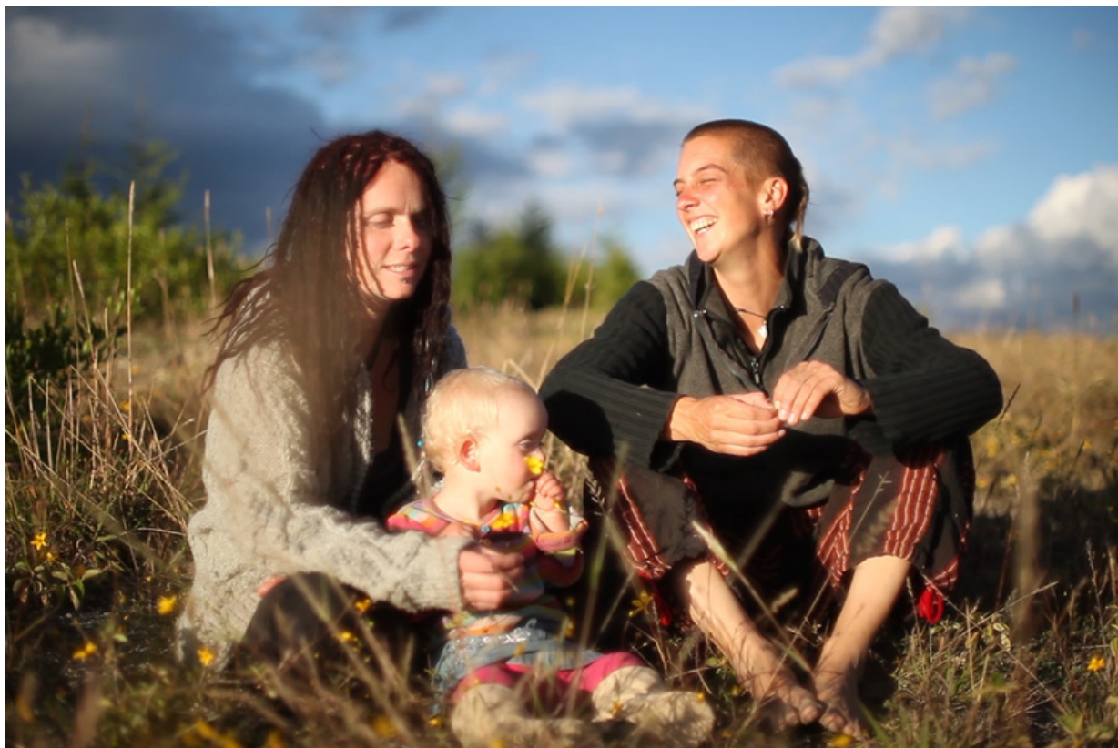
La importancia de llamarse Satya Bycknell Rothern, largometraje de Juliana Khalifé